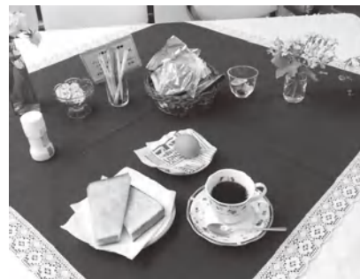
サロンのメニュー紹介

やご家族も、楽しみにされています。地域の方やボランティアさんをお迎えして、いつも会話に明るい花が咲いています。