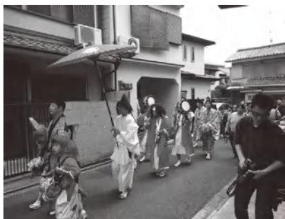
4月14日のやすらい祭り

⑥ 「地域サロンきたおおじ」は、平成25年4月14日今宮神社のやすらい祭りの日にオープンしました。昨年の開設以来「きたおおじ」は、居場所づくりや地域サロンの活動を通じて地域における役割を担っていききたいという事業目標を掲げていました。